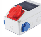
3x25A 1 AD. ÖN + 1x16A 2 AD. YAN KOMB. KUTUSU