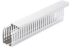
Pano Tipi Kablo Kanalı