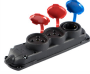
3x25A 2 Adet + 1x16A 1 Adet GRUP PRİZ