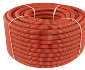
HALOJEN FREE PLASTİK SİRAL BORULAR