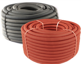
PLASTİK RENKLİ SİRAL BORULAR