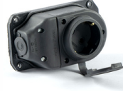
1x16A TEKLİ DUVAR PRİZİ