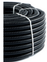
SİRAL BORU KILAVUZ TELLİ