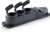
1x16A 3'LÜ GRUP PRİZ