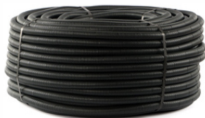
PLASTİK SİRAL BORULAR