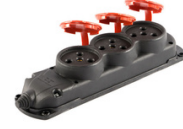
3x25A 3'LÜ GRUP PRİZ