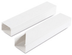
PVC Kablo Kanalı