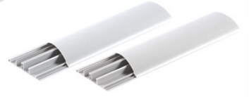
Balıksırtı Kablo Kanalı