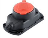
3x25A TEKLİ DUVAR PRİZİ