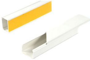
PVC Yapışkanlı Kablo Kanalı