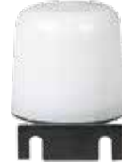
FR-G FOTOSEL GÖZ