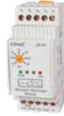
ZR-5T KLASİK DIN