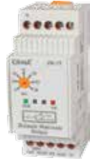
ZR-1T KLASİK DIN